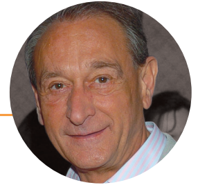
M. Bertrand Delanoë