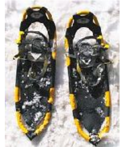
Raquette & ski de fond