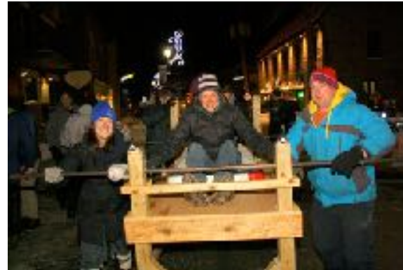
Course de lits - carnaval