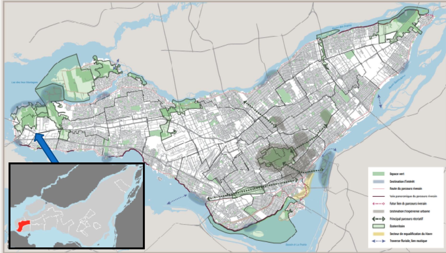
Carte 19 - Concept de la Trame verte et bleue