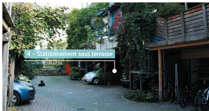
Vauban, Freiburg im Breisgau