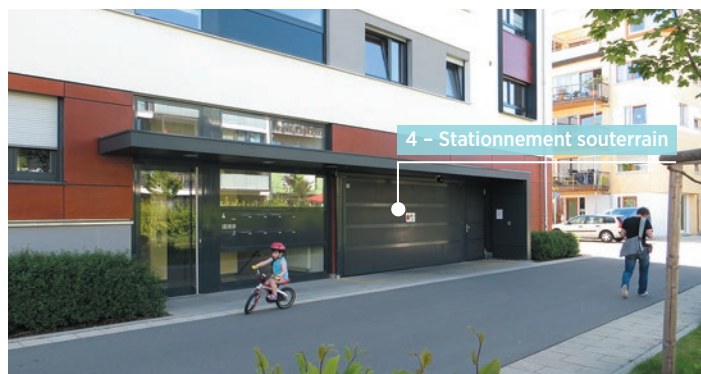
Mühlenviertel, Tübingen