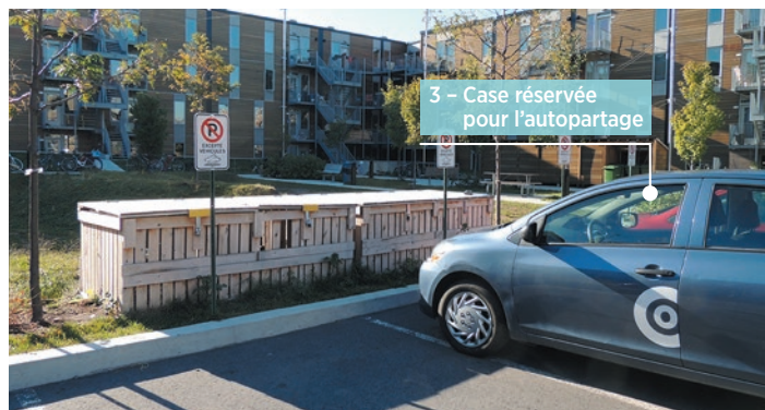
Coopérative Le Coteau vert, Montréal